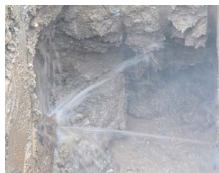
Prasklé potrubí v ulici Na Terase 23. 1. 2016

Při provozování veřejného vodovodu jsme povinni udělat 6 rozborů vody za rok, dva velkého rozsahu a čtyři malého rozsahu. Rozbory jsou vyvěšeny na úřední desce úřadu. Velké výdaje jsou za elektrickou energii při čerpání vody ze dvou vrtů do dvou studen a dále do vodojemu. Původní staré studny jsou v Bláníkách a voda stéká samospádem do vodojemu, ale jejich objem vod již nestačí. Voda ve vodojemu se upravuje proti radonu a dále se desinfikuje chlornanem sodným. Další finanční náklady vzniknou většinou v důsledku oprav prasklého vodovodního řádu v zimním období. V letošním roce budeme opravovat celý vodovodní řad v ulici Na Oboře, kde neustále praskal a tím vznikaly zbytečné náklady na opravy.