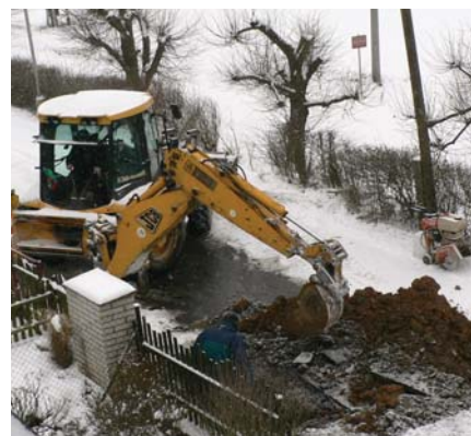
Oprava prasklého potrubí v ulici Na Terase

Při provozování ČOV jsme povinni provádět 12 rozborů vypouštěných vod ročně. Dále je nutné vyvážet vznikající kaly, které se vyvážejí 6 - 7krát ročně a vyvezení kalu se pohybuje ve výši cca 22 000 Kč. V loňském roce bylo vyvezeno 174 tun kalů.