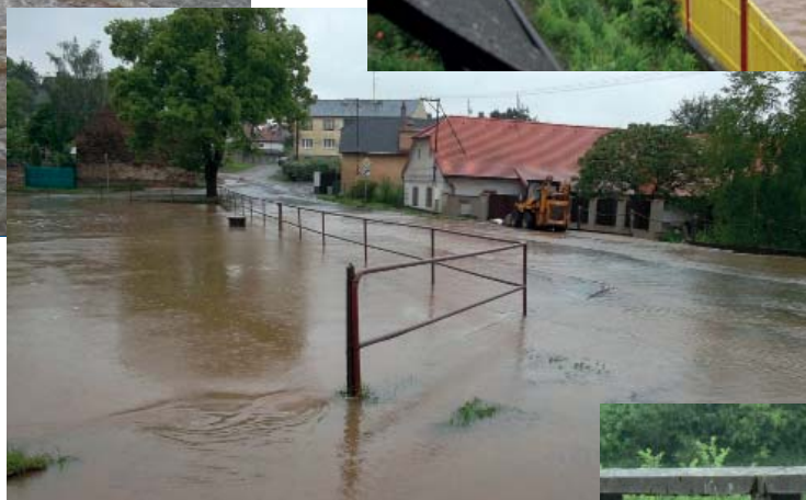
pivovarský rybník (11:07 hod.)