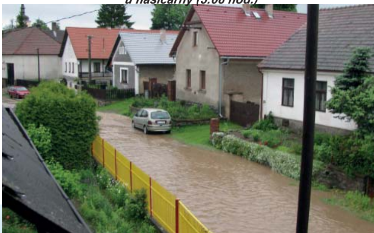
u hasičárny (5:08 hod.)