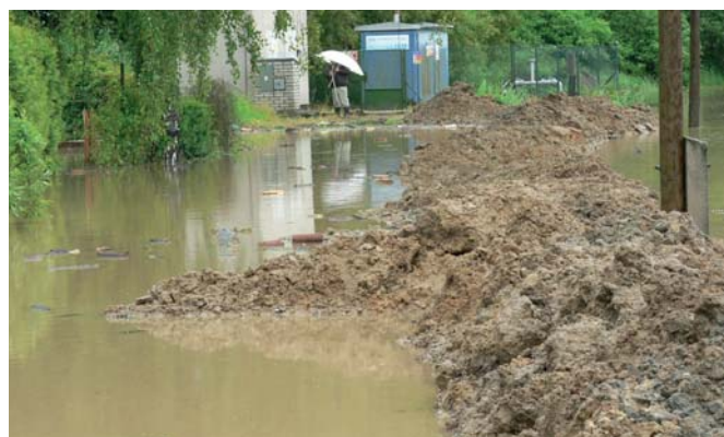
provizorní hráz na cestě ke koupališti (14:52 hod)

Dále bylo po povodni zjištěno, že chybí vypracované povodňové plány povodni ohrožených objektů, které by měl mít vypracován vlastník stavby v návaznosti na vypracovaný povodňový plán městyse. Dále je nezbytné, aby se zabránilo přívalům vody z Bláníků. Toto je potřeba řešit návrhem a zbudováním protipovodňových opatření v rámci probíhajících komplexních pozemkových úprav v Louňovicích p. Bl. V tomto směru budeme jednat s projektantem a zadavatelem komplexních úprav.