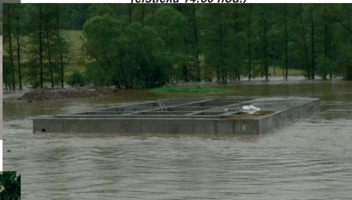
(čistička 14:50 hod.)