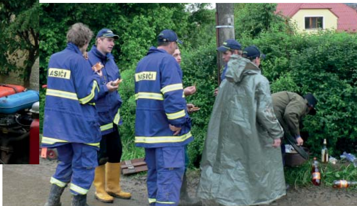
zasloužená svačina (18:53 hod)