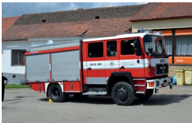
nové hasičské zásahové vozidlo

Vozidlo je vybaveno velmi účinným vysokotlakým a nízkotlakým čerpadlem a je schopno si samo vodu do nádrže nasát.