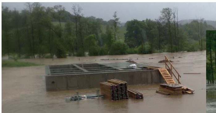
čistička (8:46 hod.)