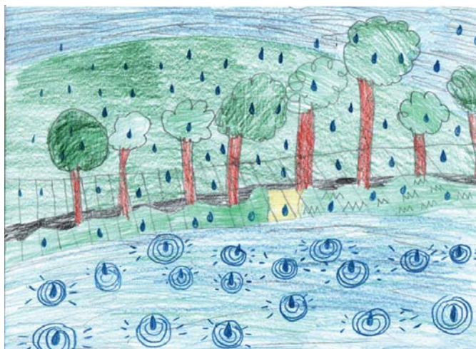
Před povodní K. Koubková 2 (1)