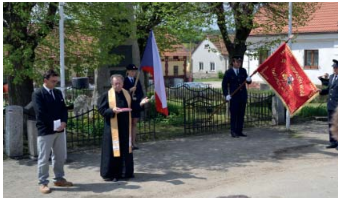
svěcení hasičského zásahového vozidla a hasičského praporu

Dne 8. 5. 2013 SDH Louňovice p. Bl. pořádal akci k zakoupení nového zásahového vozidla, a to Svěcení hasičského auta a svěcení hasičského praporu. Akce se konala za účasti široké veřejnosti v den státního svátku společně s uctěním památky padlých a položením věnce u památníku. Následovalo představení nového hasičského zásahového vozidla veřejnosti a hlavně dětem.