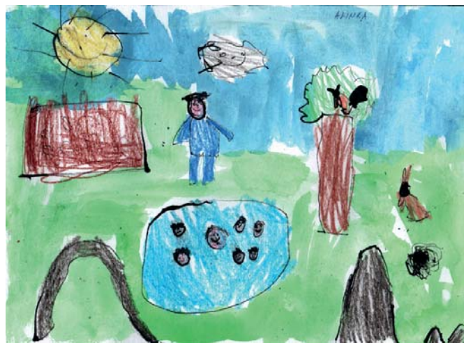
ilustrace - A. Krátká 6 let MŠ