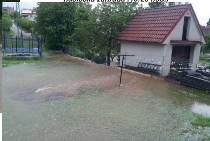
hasičská zahrada (10:26 hod.)