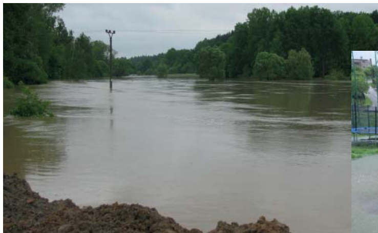
pohled ke koupališti (16:33 hod.)