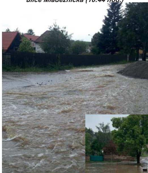
ulice Mládežnická (10:44 hod.)