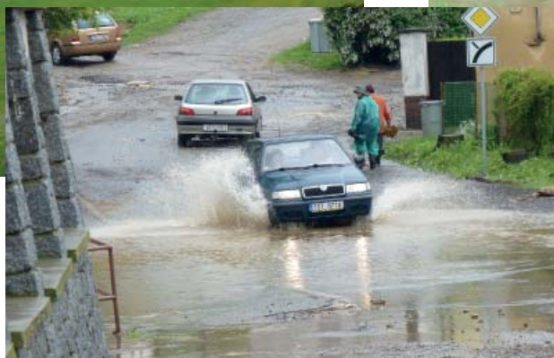
silnice u pivovarského rybníku (14:44 hod.)