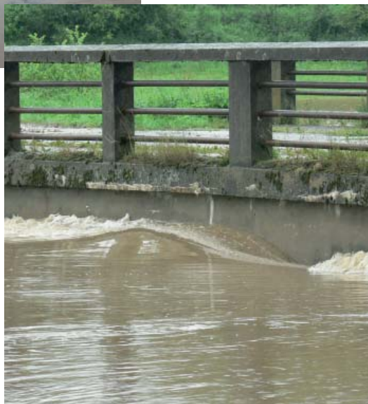
most na Libouň (14:52 hod.)