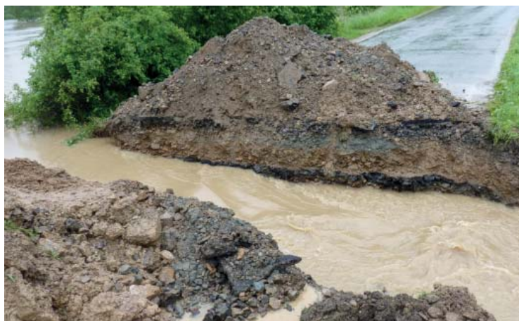
překopaná silnice na Libouň (14:23 hod.)