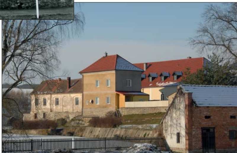
„Současný pohled na budovy Vinopalny“

Škoda, že poslední budova čp.152 je v dezolátním stavu, ta moc velkou parádu naší obci nedělá.