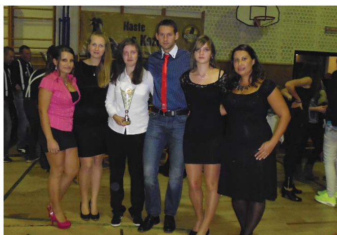
ŽENY „A“