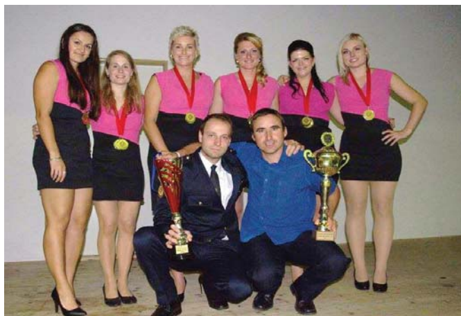
ŽENY „B“