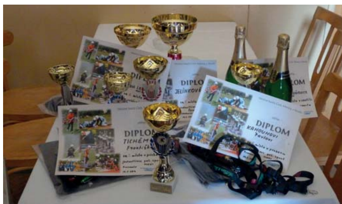
To všechno jsme tam vybrali....