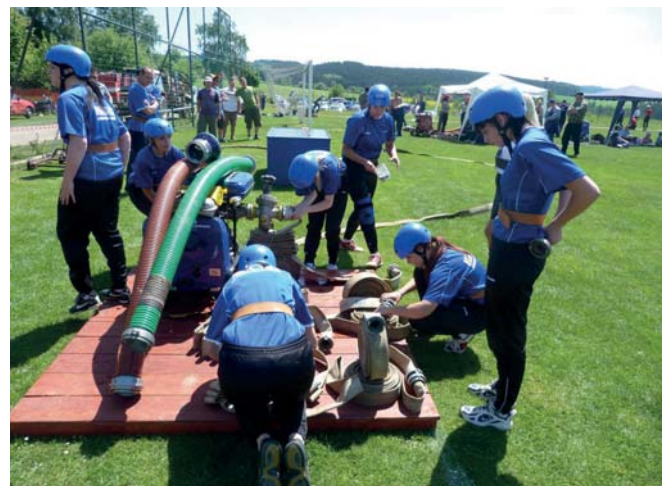
Holky na základně při přípravě na požární útok