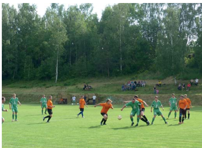
Tým A proti Tr. Štěpánovu - výhra 2 - 0