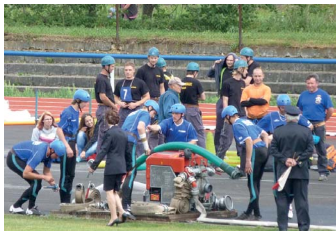
Příprava na požární útok

A neděle patřila tradičně ženám. Naše holky začaly podstatně lépe než kluci, avšak celkový výsledek byl nakonec 6. místo. Celkem se zúčastnilo 10 ženských týmů.