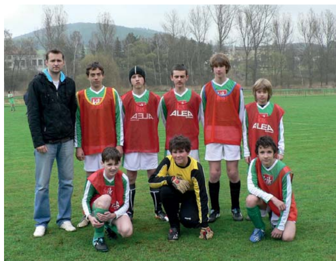
Žáci před prvním zápasem letošního jara