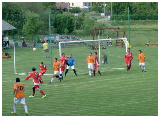
Tým B proti Tichonicím - výhra 2 - 0