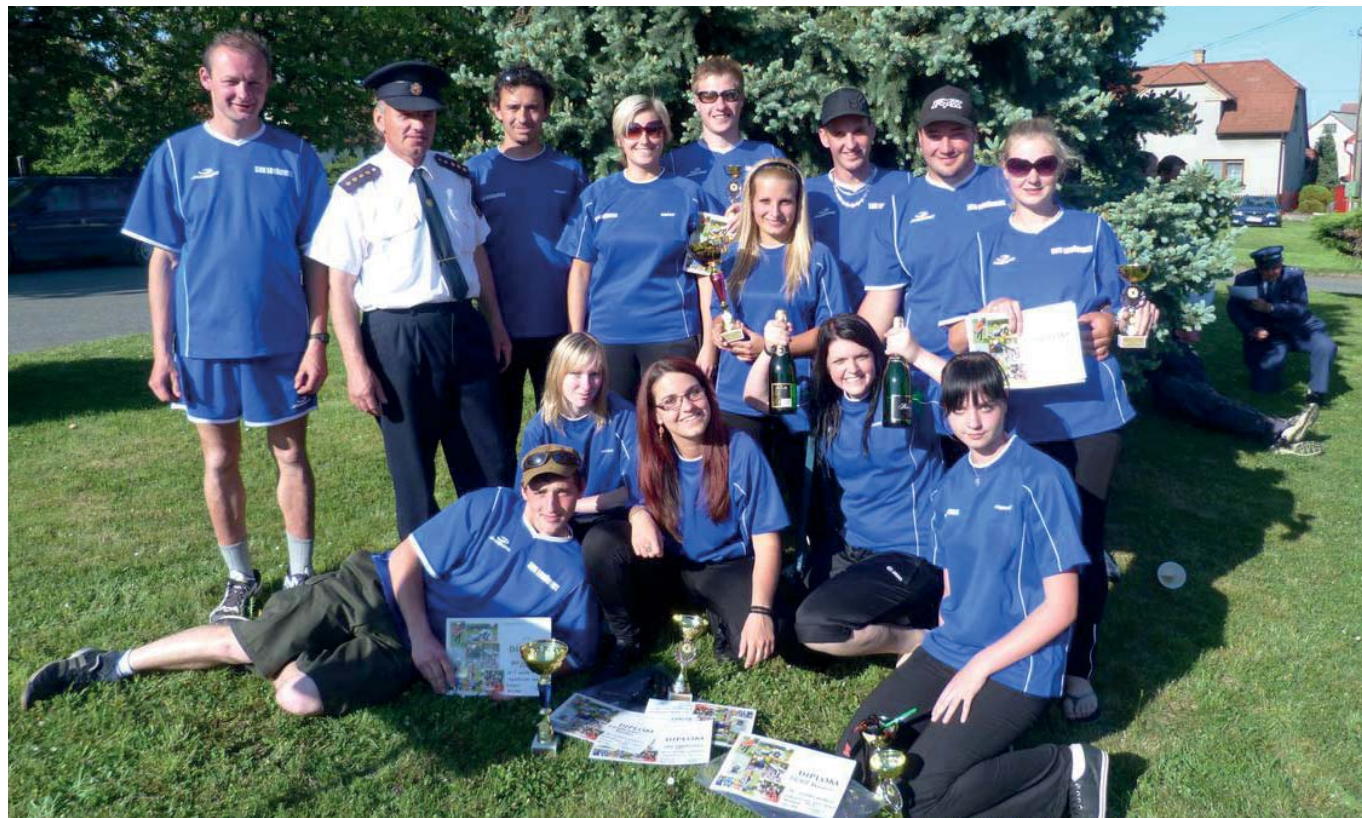
Společné foto na závěr